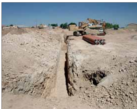
La ministra visitó las obras en sus inicios.

Asimismo, el trabajador de Aquagest recordó que la obra ha consistido en la instalación de una nueva tubería de abastecimien-