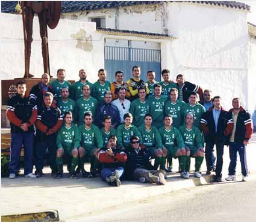
La UD Carrión está realizando una temporada magnífica.

Primera Preferente, que es donde podemos estar por nivel deportivo.