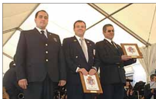
La banda de la Agrupación Musical Calatrava La Vieja se desplazó hasta la localidad de Carrión de los Condes.

La Agrupación Musical participó en el XI Certamen de Bandas de Música de Carrión de los Céspedes