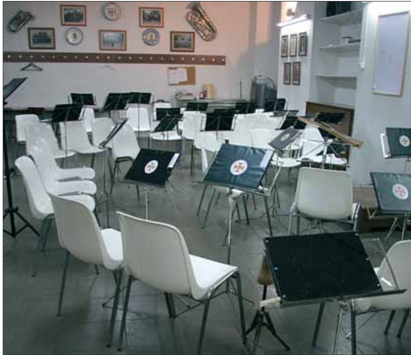
Imagen de la sede de la Escuela de Música, en la Casa de Cultura.

Lo cierto es que sí. De hecho, hace dos años entraron 14 niños. Y fue el impulso más creciente que ha tendido la banda. Este año hemos incorporado a tres y más. Y tengo la esperanza de que al acabar este curso se puedan incorporar cuatro o cinco más. Lo que buscamos es contar con 60 o 70 músicos, con lo que tendríamos todas las necesidades cubiertas.