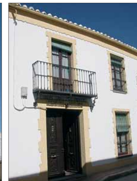
Carrión de Calatrava es uno de los municipios con más historia de la provincia.

Tras esto, el comendador de Calatrava la Vieja, que tenía su residencia fijada en el Turrillo, decide establecerse en Carrión. Compra y edifica casa en los primeros años del siglo XVI y aunque hay oposición por parte del concejo, la casa de la encomienda se establece en Carrión y la misma enco-