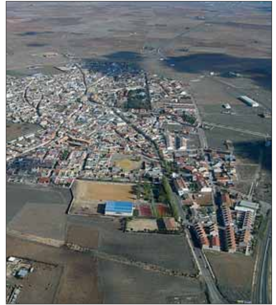
Carrión, una localidad con futuro.

La Comisión Provincial de Urbanismo, igualmente, ha aprobado de forma definitiva la creación de