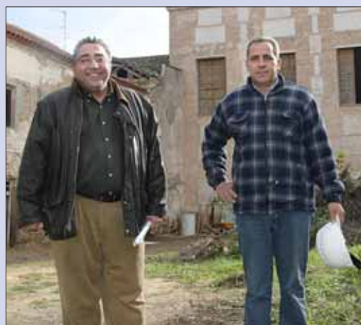
Las alumnas están recibiendo formación práctica.

En este sentido, Barragán señaló que han reformado los baños y han mejorado sustancialmente las instalaciones de la Casa de la Cultura. “Necesitábamos un lugar donde practicar todo lo que les enseñamos, y si al mismo tiempo podemos hacer algo positivo para la localidad, mucho mejor”, afirmó el responsable de la Escuela Taller.