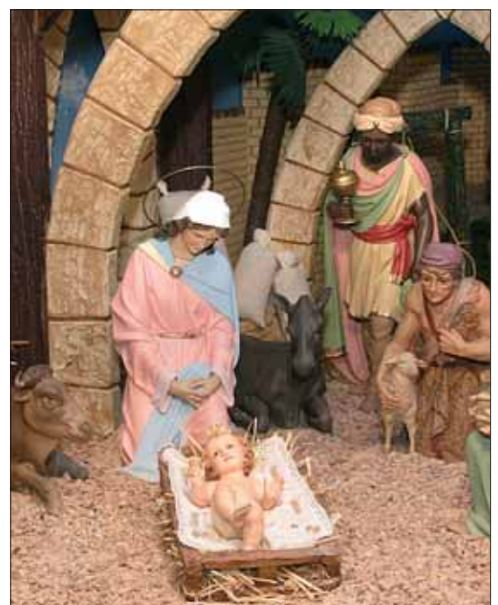
Imagen de un Belén tradicional.

invitación para dos personas para el Cotillón de Nochevieja que organiza el Ayuntamiento de Carrión de Calatrava.