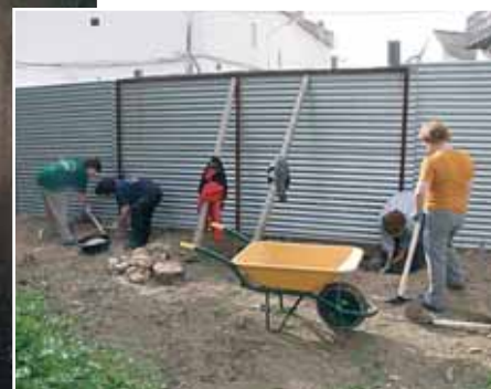
Varias imágenes de la situación actual del Torreión y de las alumnas trabajando.