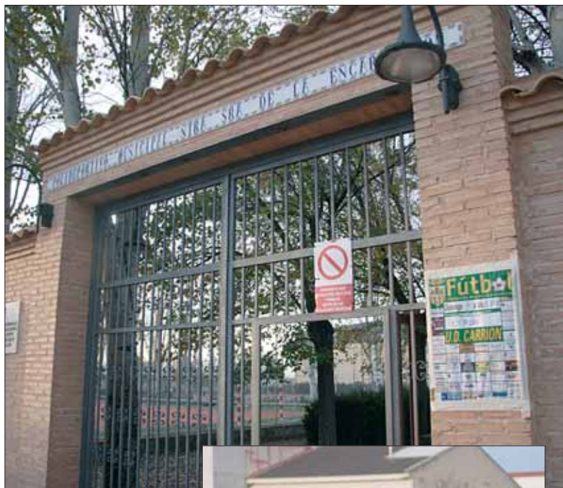
Carrión de Calatrava disfruta de unas buenas instalaciones deportivas.

Lo estamos intentando. Estamos reestructurando el club. Atando cabos. Y es que, en un municipio pequeño, que exista un equipo de fútbol depende también de la población: no siempre hay fútbol. Y no siempre puedes traer a ocho o nueve chicos de fuera porque deja de venir público. Ese es el