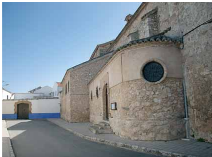
Turrillo y Carrión fueron sedes de la casa de la encomienda.

De los años 1329 a 1347 hay dos sentencias